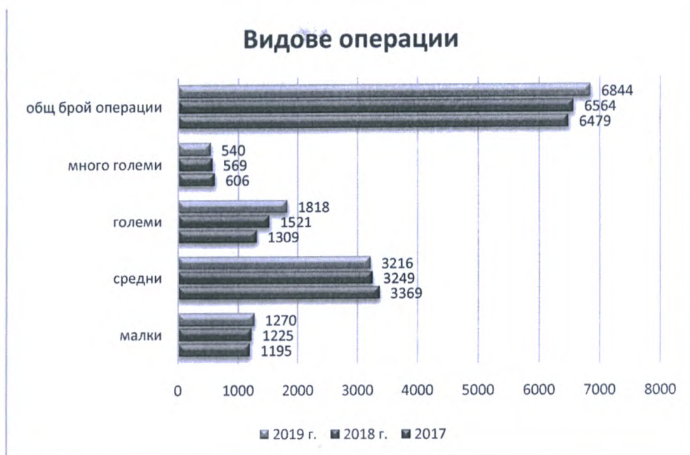
Фигура 2 Видове операции по сложност по тримесечия за тригодишен период

През 2019 г. се констатира увеличаване на оперативната дейност в сравнение с предходните две години за сметка на големите оперативни интервенции.